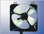
DAIHATSU CHARADE G102