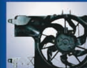
VW GOL III