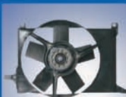
GM CORSA N